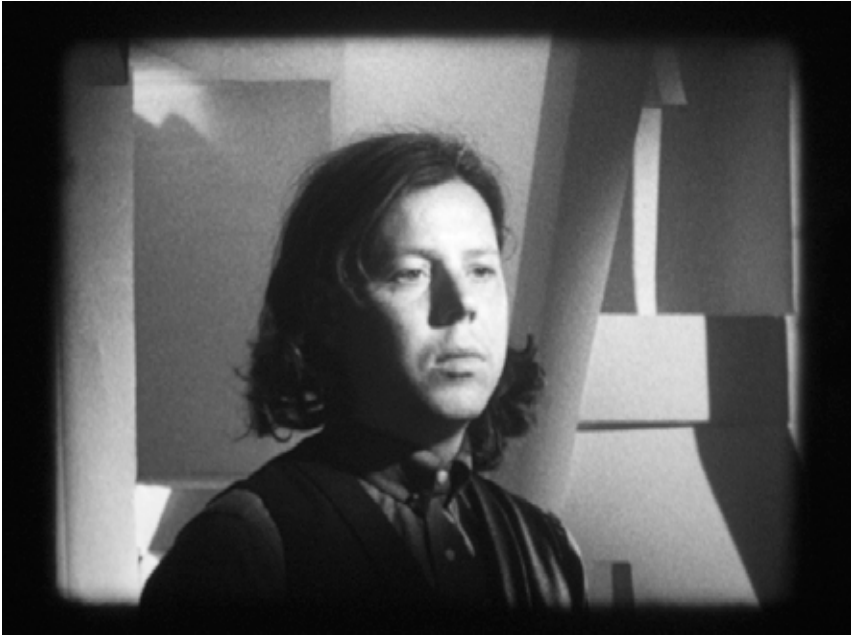
Joachim Koester, I Myself Am Only a Receiving Apparatus , 2010 Film 16 mm, noir et blanc, muet, 3'33"