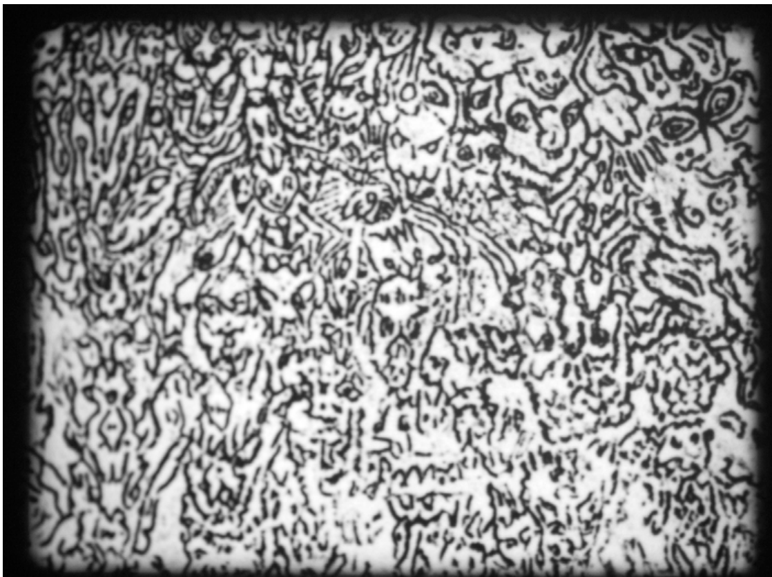
Joachim Koester, Demonology , 2010 Film 16 mm, noir et blanc, muet, 4'12'' Courtesy Nicolai Wallner, Copenhague ; Jan Mot, Bruxelles Production Institut d'art contemporain, Villeurbanne/Rhône-Alpes