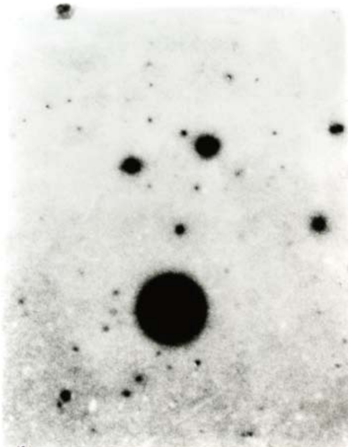
Message from Andrée , 2005 Installation, film 16mm, noir et blanc, muet, 3'30'' photographies noir et blanc