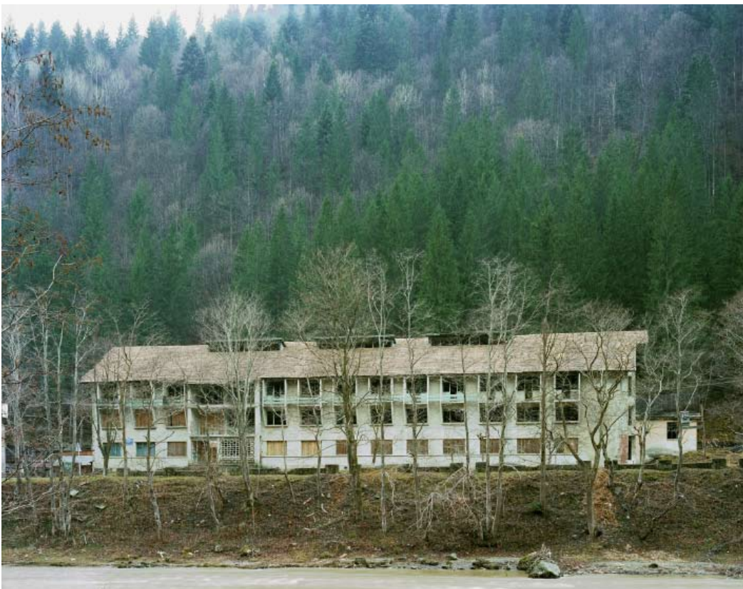
From the Travel of Jonathan Harker, 2003 Photographies, tirages numériques