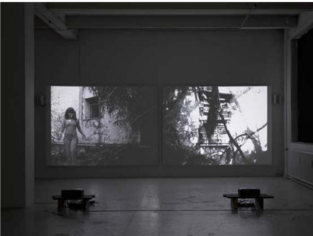
One + One + One , 2006 Film 16mm transféré sur DVD, noir et blanc, son, 5'03'' et 6'