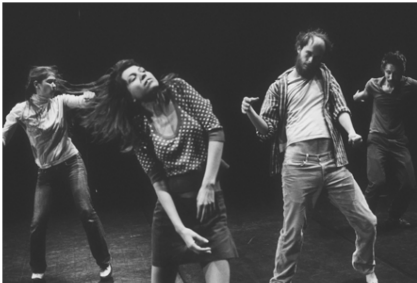
Tarantism , 2007 Film 16 mm, noir et blanc, muet, 6'30" Courtesy Jan Mot, Bruxelles