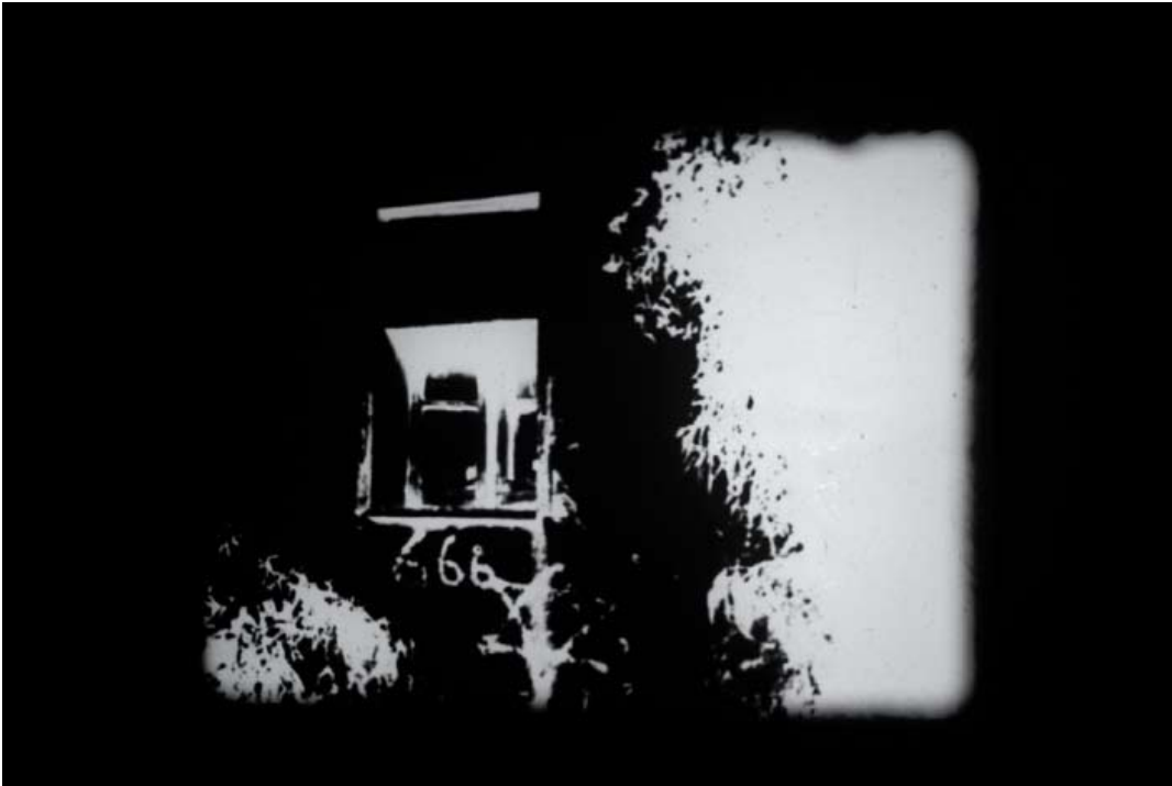
Morning of the Magicians , 2006 Film 16mm, noir et blanc, muet, 4'50''