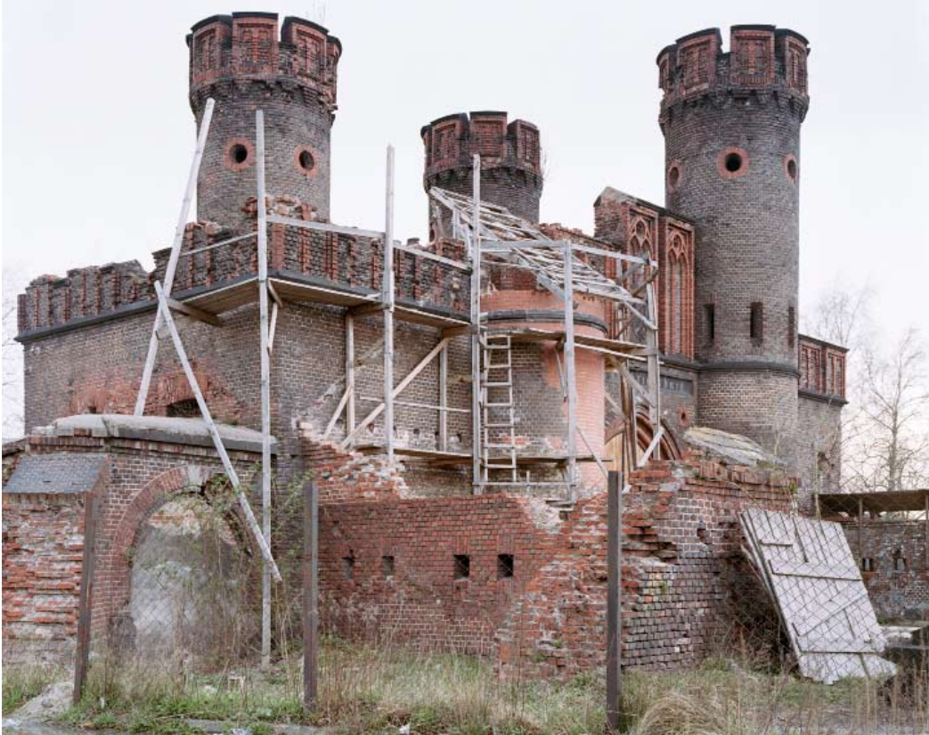
The Kant Walks, 2005 Photographies, tirages numériques