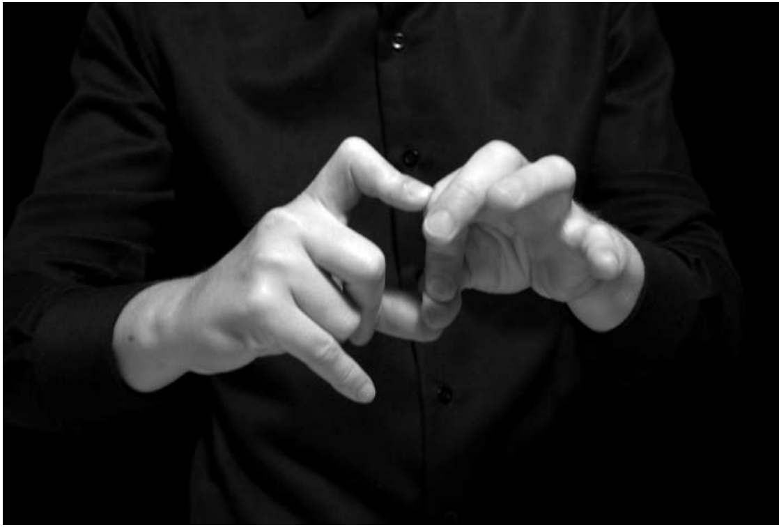
Joachim Koester, Variations of Incomplete Open Cubes , 2011 Film 16 mm, noir et blanc, muet, 8'15'' Courtesy Jan Mot, Bruxelles Production Institut d'art contemporain, Villeurbanne/Rhône-Alpes