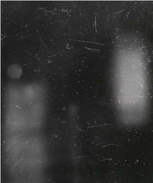
The Magic Mirror of John Dee , 2006 Photographie, tirage gélatino-argentique viré au sélénium Collection privée, Paris